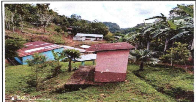
Foto 4: Se Observa el deterioro del techo, tambien el desprendimiento de puntas en las paredes modulo 3