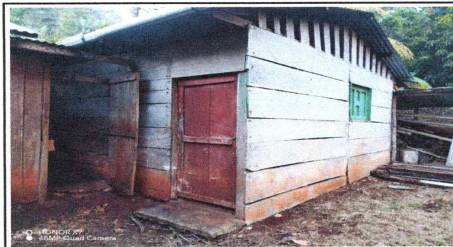
Foto 3: Se observa el mal estado de la puerta, tambien el deterioro del techo modulo 2 de la cocina